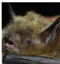
Gr/Kl. Bartfledermaus (Mbart)