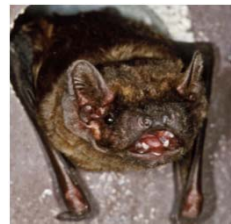
Gr. Abendsegler (Nnoc)

Aktivität aller Nächte; in 15 Min Intervallen dargestellt