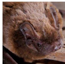
Kleiner Abendsegler (Nlei)